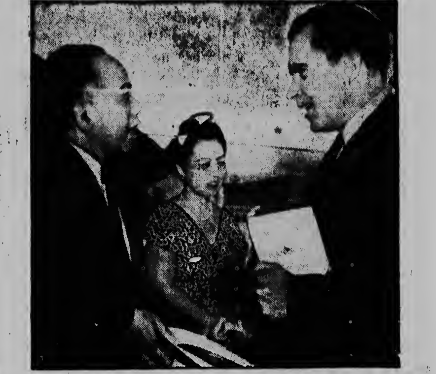
E vice-president di Merca Richard Nixon a caba di haci un bisbita di relampago na algun pais Oriental. Ela keda dos dia na Philipinas na unda ela wordo recibí door di president y senjora Magsaysay. Nixon a declara cu neutralidad na Lejano Oriente no ta posibel, e henderan ta pro of contra di comunismo, e no ta welta un caminda medio. For di Indonesia y India ya tabatin protesta caba contra di e expresion aki.

Bo kier mas cos den corant of algo otro? Scirbi nos duna nos Bo ideanan (Direccion: Awakatistraat No. 2 Dakota)